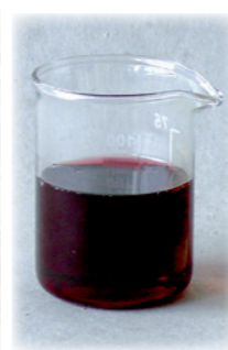
Třezalkový olej (červený)