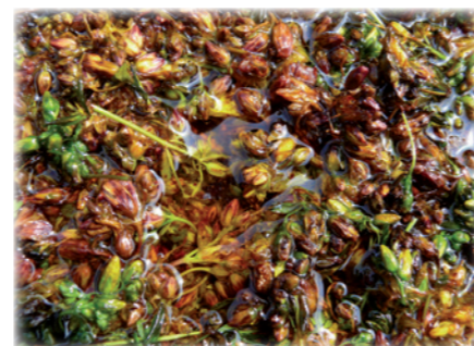
První dny macerace.