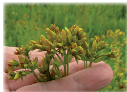
Třezalka - květ

Než jsem začal psát toto pojednání, hodil jsem oko na internet. Ve vyhledávači jsem zadal, postupně v několika jazycích heslo „třezalkový olej“. Nestáčil jsem se divit, co vše je mnohými „specialisty“ jako „třezalkový olej“ nabízeno, co je o něm psáno, jak zde jím i straší. Nelze se pak divit, že uživatel takovýchto „starých dobrých třezalkových olejů“ je prostě zklamán.