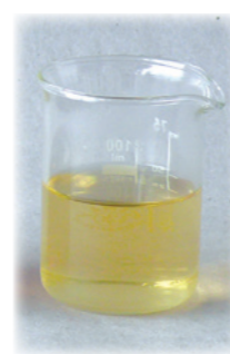
Základní macerační olej (mandlový).

Jedna ze starých moudrostí praví: „Darovat dělá radost“. A tak mě napadlo poděkovat každému zákazníkovi za objednané zboží nikoli slovy, ale zprostředkováním poznání.